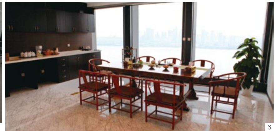
1 2 3 办公区 4 图书区 5 会议室 6 员工休息间 7 模拟法庭 8 会客室